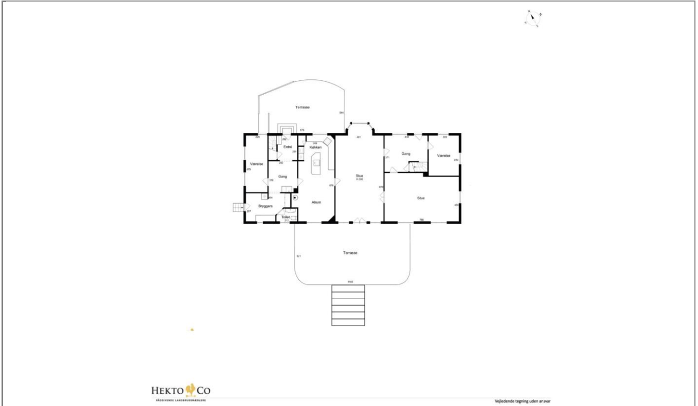
Orebyvej 80 – Erdgeschoss