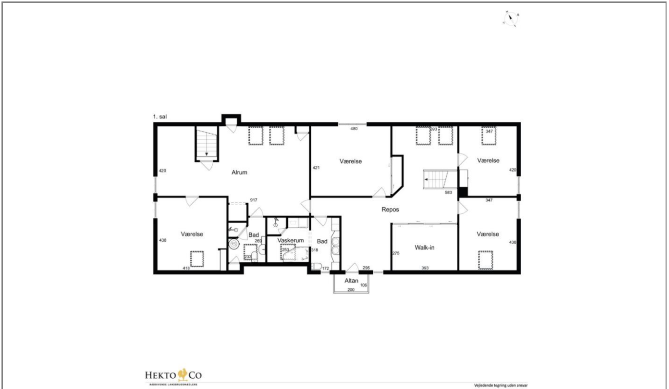
Orebyvej 80 – 1. Stock